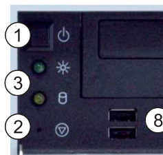
Vorderseite (hinter Frontklappe)

Öffnen Sie die Frontklappe mit dem zugehörigen Schlüssel, um Zugang zu den Bedienelementen zu bekommen.