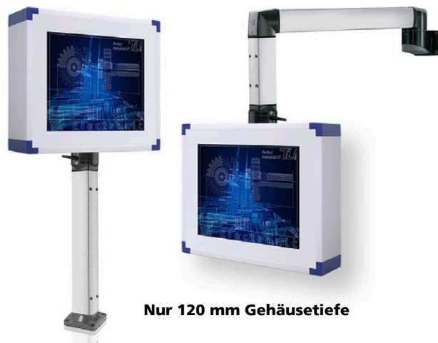
Nur 120 mm Gehäusetiefe