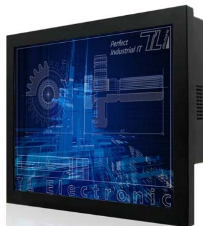
(Abb. WM 15 und WM 19)